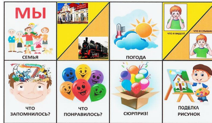
Мнемотаблица «Маршрут выходного дня»

✓ предложите совместно нарисовать рисунок или сделать поделку для выставки в детском саду.